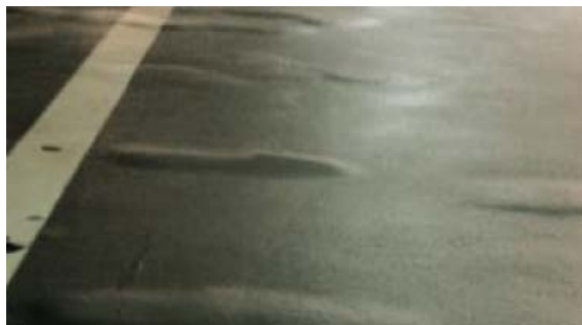
左图：板坯整修前后的截面图； 右图：脱落的沥青